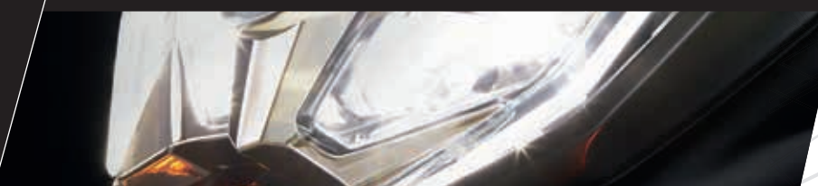
Der Voll LED-Scheinwerfer.