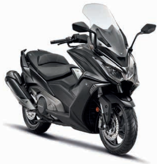
KYMCO AK 550i ABS schwarz

Starten Sie jetzt und entdecken Sie den ersten seiner Art in allen Details.