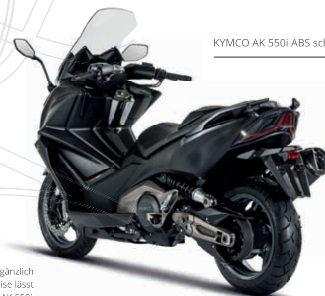
KYMCO AK 550i ABS schwarz