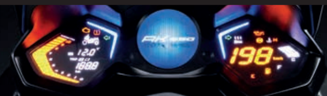
Das interaktive Cockpit.

Vom feinfühligem Anbremsen bis zur kompromisslosen Notbremsung, das Zusammenspiel von Bremsen und Fahrwerk überzeugt Zweiradexperten und Neueinsteiger gleichermaßen. Außerdem ist der AK 550i ABS mit dem neusten und leichtesten Bosch 9.1 ABS System ausgestattet, das mit seiner beeindruckenden Reaktionszeit für zusätzliche Sicherheit sorgt.