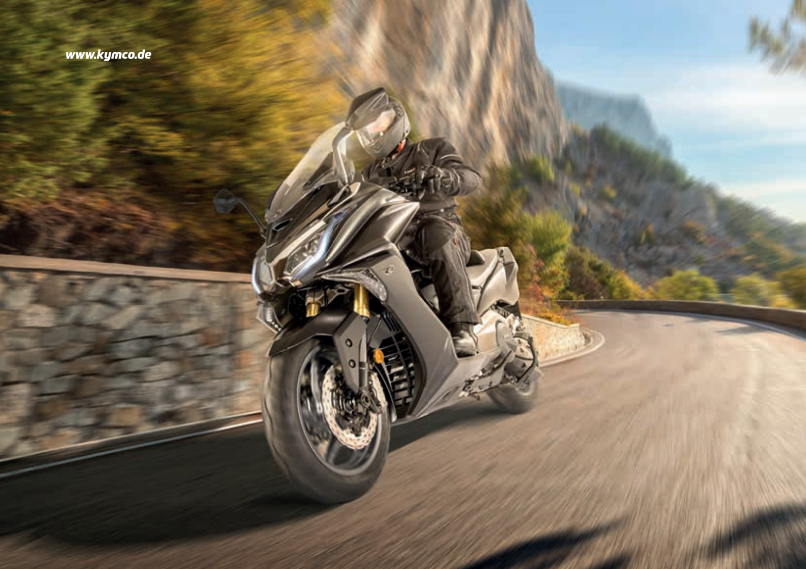
Egal ob auf der Langstrecke oder in sportlichem Terrain, der AK 550i ABS besticht überall mit Leistung.