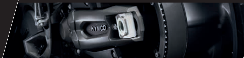
Innovationen im Antriebsbereich.