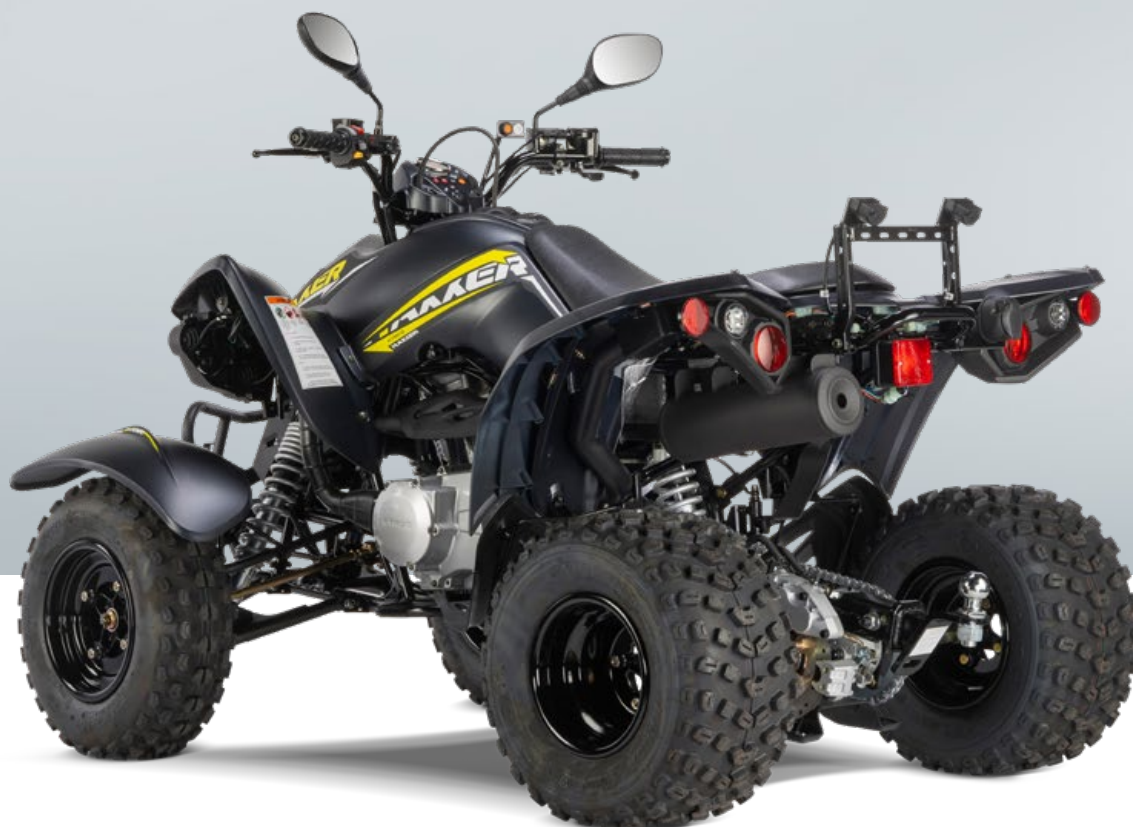
KYMCO MAXXER 300 T OFFROAD LOF in schwarz/grün