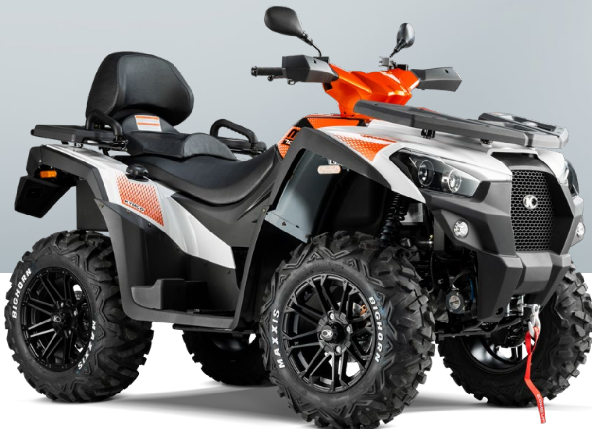
KYMCO MXU 700i EPS ABS T3b in weiß / orange