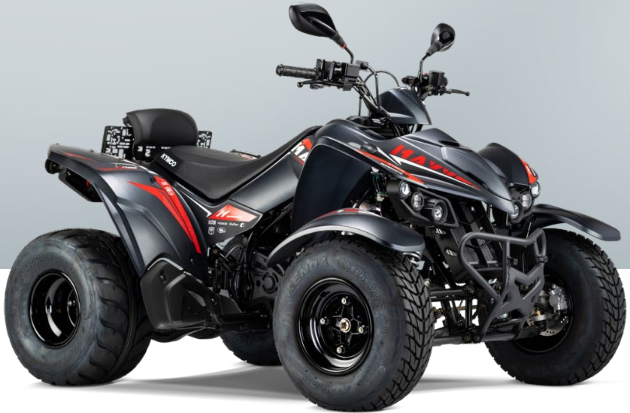
KYMCO MAXXER 300 T ONROAD LOF in schwarz/rot