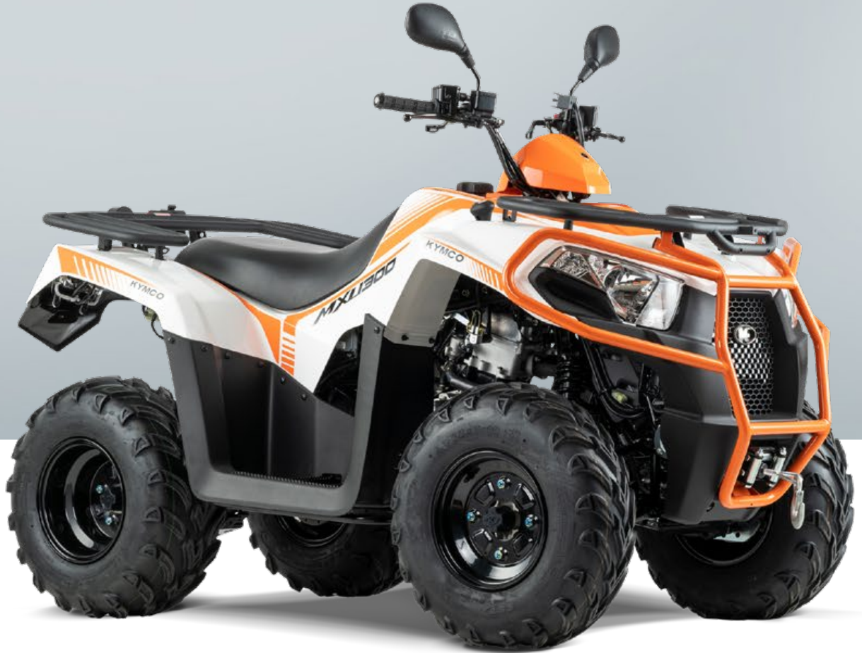
KYMCO MXU 300i T OFFROAD LOF in weiß / orange