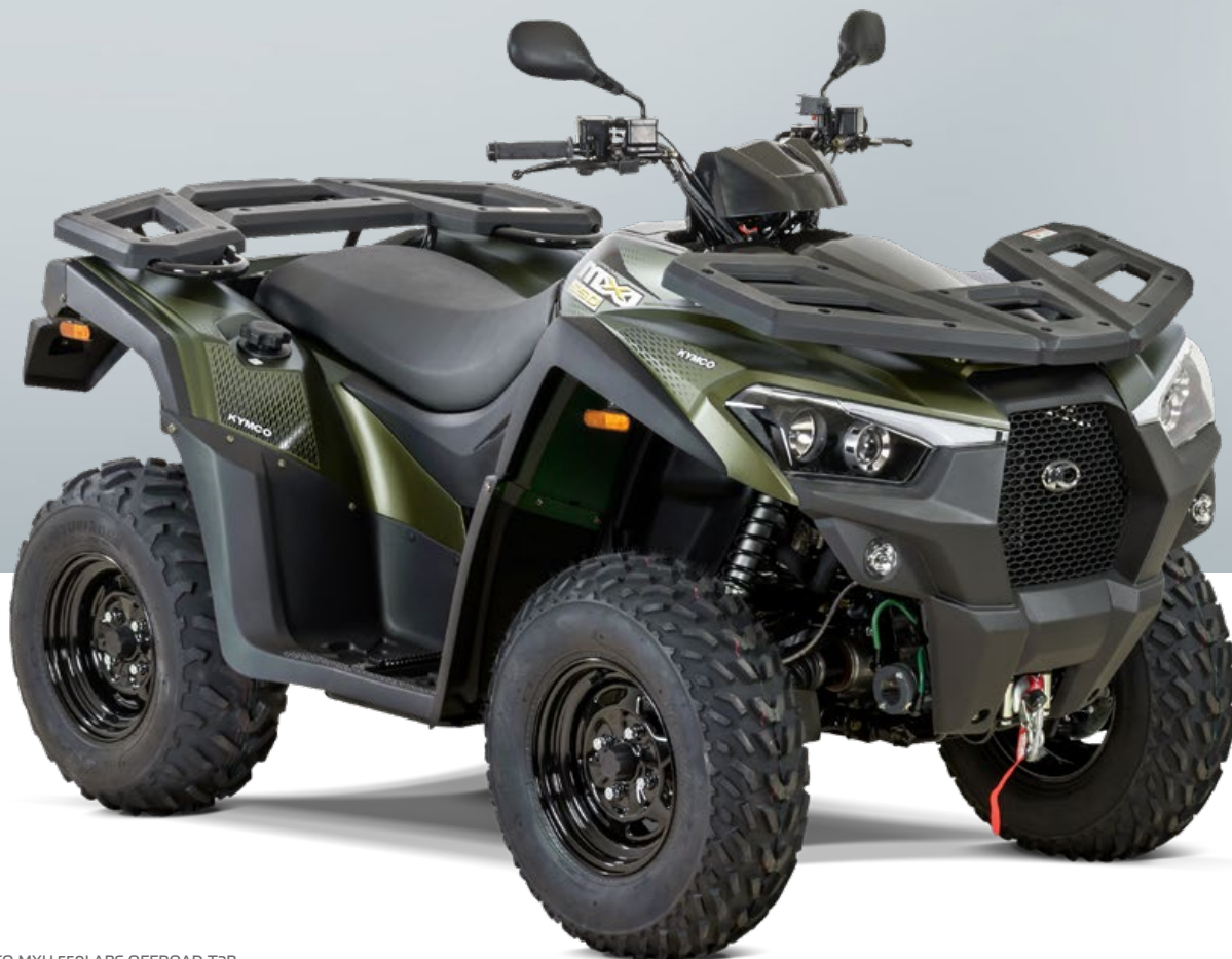
KYMCO MXU 550i ABS OFFROAD T3b in dunkelgrün