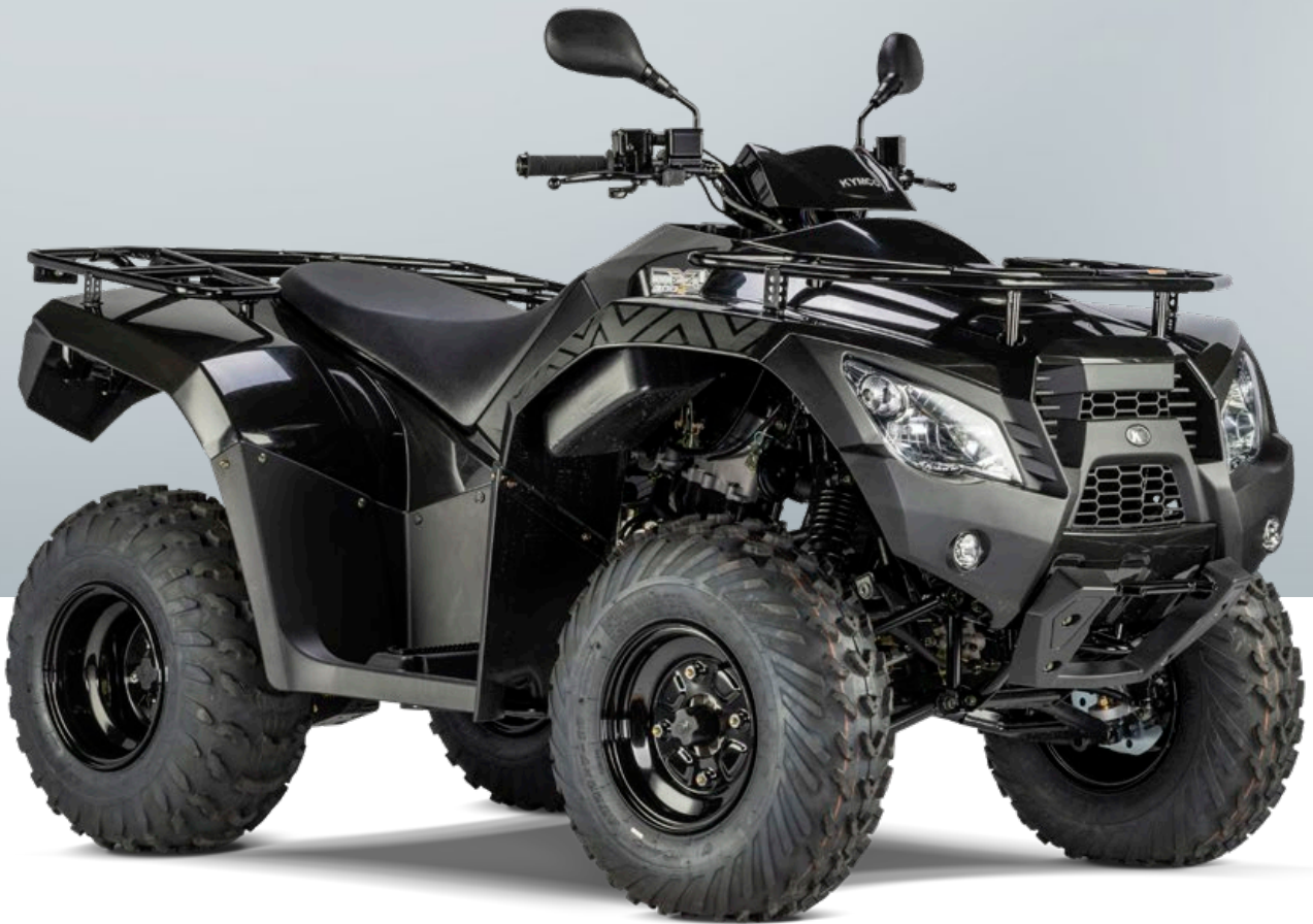
MXU 300 R T LOF in schwarz